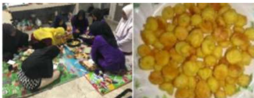
Gambar 3 Dokumentasi Pengabdian Masyarakat

Selain meningkatkan pengetahuan dan keterampilan anggota PKK, kegiatan pengabdian masyarakat ini juga meningkatkan motivasi serta kesadaran akan potensi yang dimiliki masyarakat setempat dengan output yaitu perekonomian. Tingginya minat dan partisipasi anggota PKK membuat kegiatan ini lebih menarik. Metode demonstrasi berupa